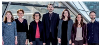
Les experts toxicologues et écotoxicologues d'Equitox.

"Notre expérience dans l'industrie, au service de différents secteurs de la chimie (intermédiaires de synthèse, extraits de produits naturels, substances pures ou mélanges complexes...) et sur